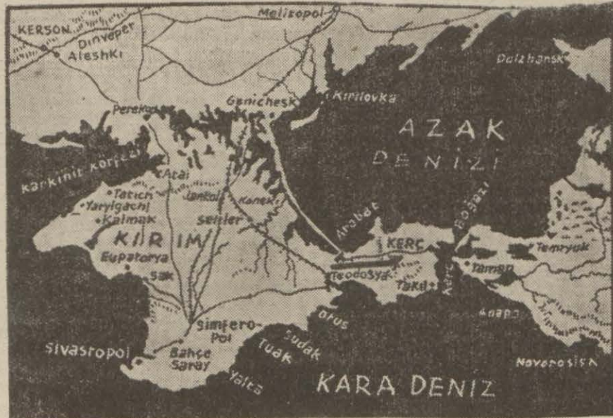
Kırım yarımadasını ve Alman taarruz istikametini gösterir harita

Tokyo, 13 (A.A.) — Japon gazeteleri, Kerç yarım adasındaki telgraflarını «İlkbahar Alman taarruzu başladı» başlı. (Devamı 5 inci sayfa)