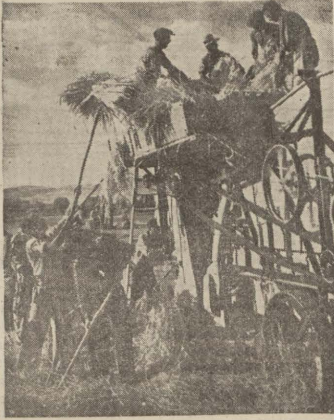
Yurdumuza aid bir hasad manzarası den bir tahmin yürütmek mümkün değildir. Pa- muk rekoltesinin istikbali, önümüzdeki haftalar iç- indeki hava şartlarına bağlıdır.

Ziraat Vekâleti hasad için 28 biçer, döğer makine daha yolladı